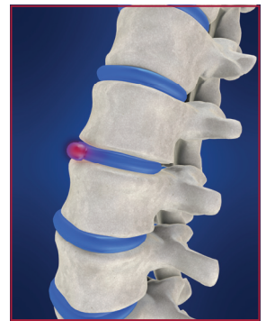
Untersuchung des Bewegungsapparates

Schmerzen des Bewegungsapparates sind oft Folge von Verletzungen, Fehlhaltungen und Abnutzungserscheinungen. Im Rahmen eines Orthopädie-Checks wird die Geschichte Ihrer körperlichen Beschwerden erhoben und Ihr Bewegungsapparat eingehend befundbezogen untersucht. Notwendige therapeutische Maßnahmen werden Ihnen verständlich erläutert. Die orthopädische Untersuchung erfolgt in Kooperation mit dem Rehazentrum Potsdam (RZP). Der ärztliche Leiter des RZP, Ben Dieminger, ist Orthopäde und Unfallchirurg und steht Ihnen als Spezialist zur Verfügung. Er ist sowohl in der operativen Orthopädie wie auch in der ambulanten Rehabilitation erfahren.